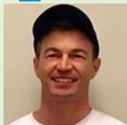
ケリン先生 LW優秀認定校 イエローハウス代表