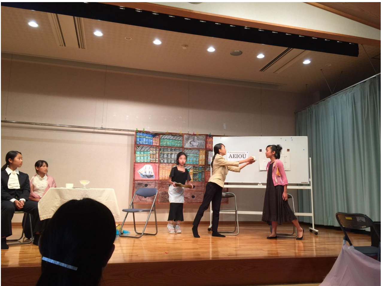
(2016年度 発表会：「My fair lady」のオープニングの1コマ)

昨年の「My fair lady」は言語学者のビギンズ教授が下町の粗野な言葉使いの娘イライザに正しい英語を教える物語で、上の写真は教授宅で、花売り娘に英語を教えているシーンです。